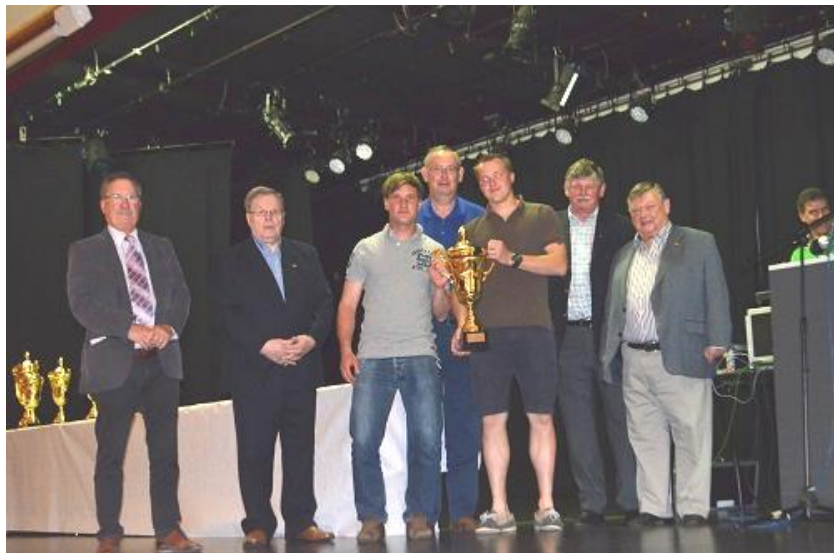
FC LEMBEEK A – KAMPIOEN 3DE AFDELING A