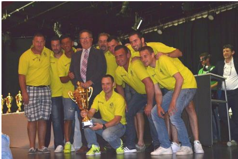
FC DOGS UNITED – KAMPIOEN 3DE AFDELING D