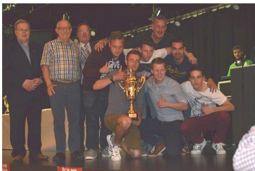
EENDRACHT VILVOORDE – KAMPIOEN 3DE AFDELING C