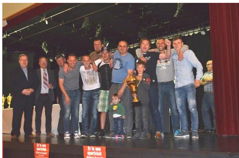
VC VISIE – KAMPIOEN 3DE AFDELING B