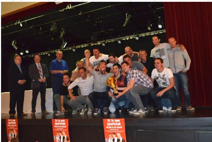
VK DE SJOETERS A – KAMPIOEN 2DE AFDELING A