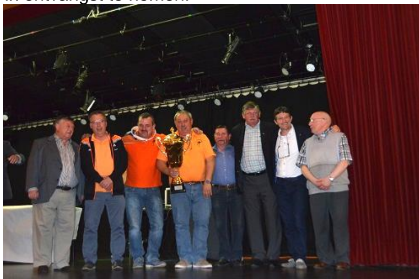
FC CAFEBOONTJES A – KAMPIOEN 1STE AFDELING