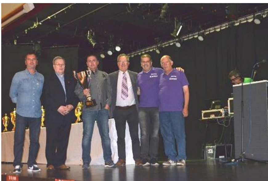
SPORTING CORNER – BEKERWINNAAR VETERANEN