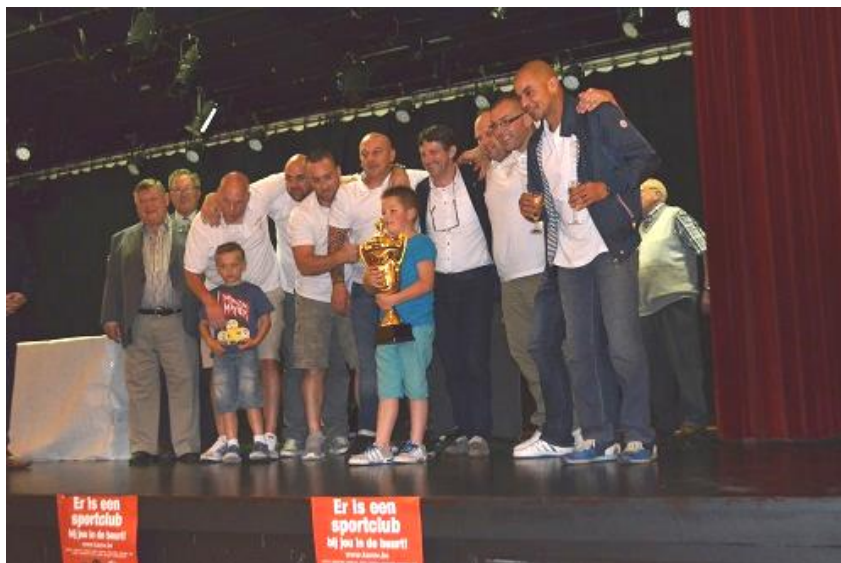
JB UNITED V - KAMPIOEN 3DE AFDELING E